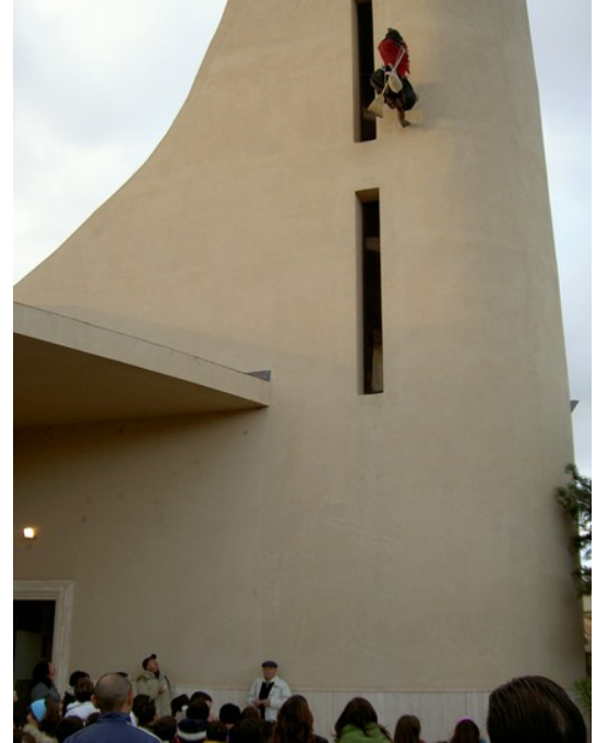
Festa della Befana 2007

Domenica 6 gennaio si concluderà il periodo natalizio con la Festa della Befana e la premiazione dei concorsi del disegno e della lettera a Gesù Bambino .